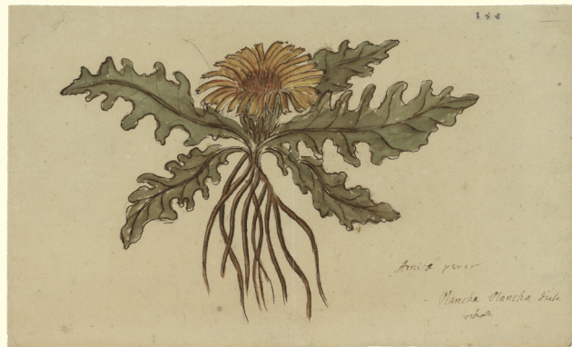
Arnica peruana, Hypochaeris meyeniana (Walp.) Benth. & Hook.f. ex Griseb. (Asteraceae), 1795, RJB-CSIC

Destaca la variedad de los intereses científicos de Haenke y su fascinación por la naturaleza americana que queda evidenciada en la diversidad de temáticas por las que se interesó. Sus dibujos de botánica ponen en diálogo la investigación científica con los intereses económicos del colonialismo del siglo XVIII sobre los que la expedición Malaspina-Bustamante también pretendía avanzar. Desarrolló indagaciones en el ámbito médico gracias a su educación previa y a través al contacto con poblaciones indígenas que compartieron su conocimiento sobre las propiedades curativas de determinadas plantas, aplicando sus conocimientos para mejorar las condiciones de vida de las poblaciones locales.