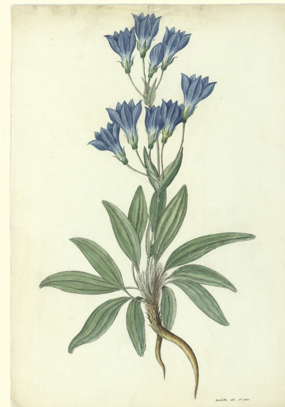
Gentiana sp. (Gentianaceae), RJB-CSIC