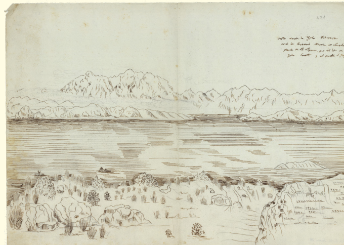
Lago Titicaca (Perú), RJB-CSIC