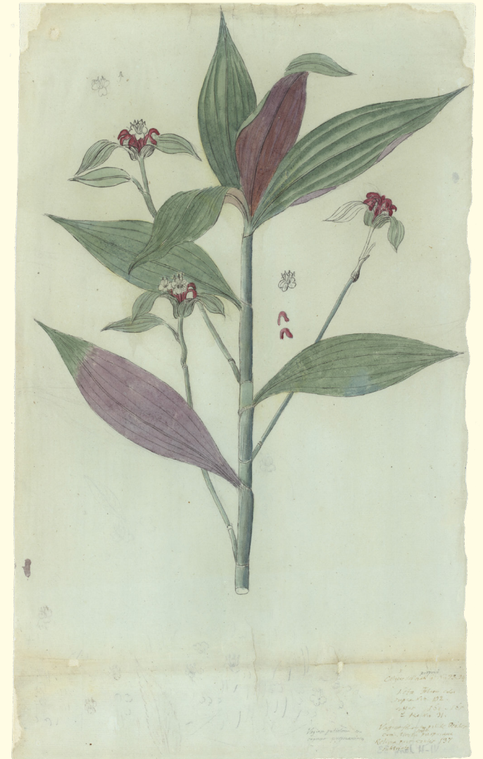
Tradescantia zanonía (L.) Sw. (Commelinaceae), RJB-CSIC

La muestra deja testimonio del carácter multidisciplinar de la actividad científica de Haenke que, además, fue enormemente prolífico y sistemático en su forma de trabajo con ejemplos relativos a la geografía y zoología locales, así como representaciones relativas a la cultura y sociedad local.